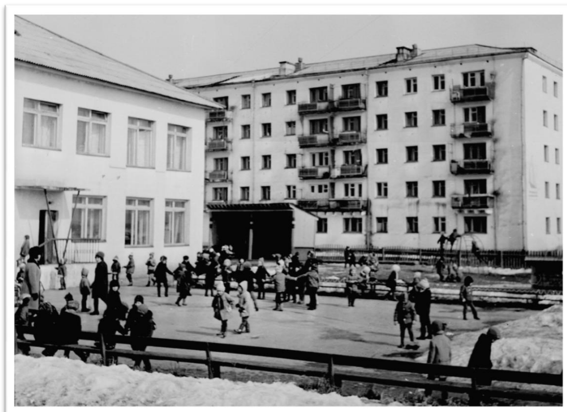
г. Киренск. Детский сад. Дата съемки: 1975 г. Место съемки: г. Киренск, Иркутской области.