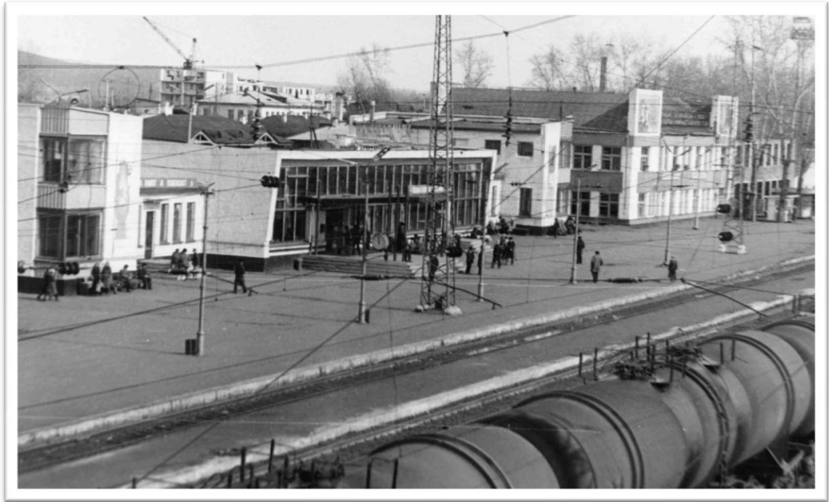
Станция Нижнеудинск Восточно-Сибирской железной дороги. Дата съемки: 1985. Место съемки: Нижнеудинск. № 4782 ч-бп.