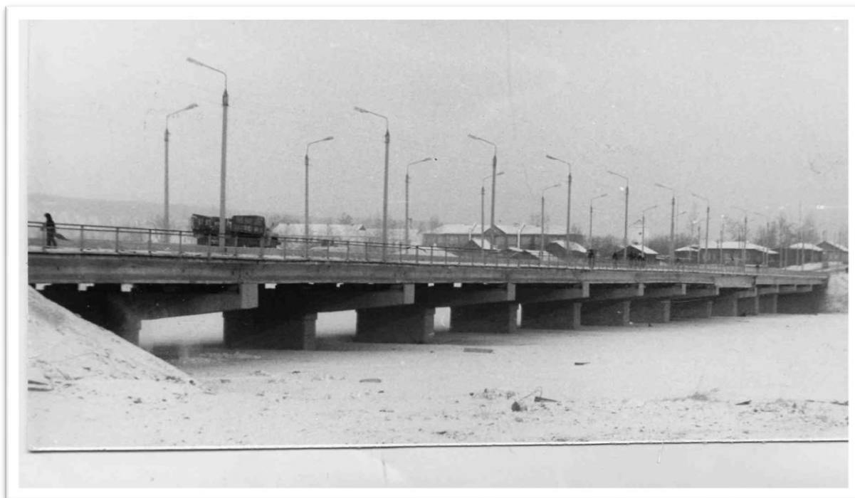
Новый мост через р.Уда, сдан в эксплуатацию в 1986 г. Дата съемки: 1986 г. Место съемки: Нижнеудинск, Иркутская область. Основание: Фотофонд. № 4031 ч-бп.