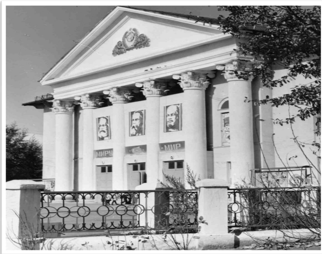
Дом культуры им. В. И. Ленина. Дата съемки: 1983 г. Место съемки: Нижнеудинск. Основание: Фотофонд. № 3922 ч-бп.