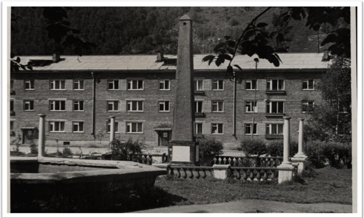
г. Слюдянка. Памятник на братской могиле красноармейцев и рабочих, погибших в 1918-1922-е гг. Дата съемки: 1984 г. Место съемки: г. Слюдянка, Иркутская область.