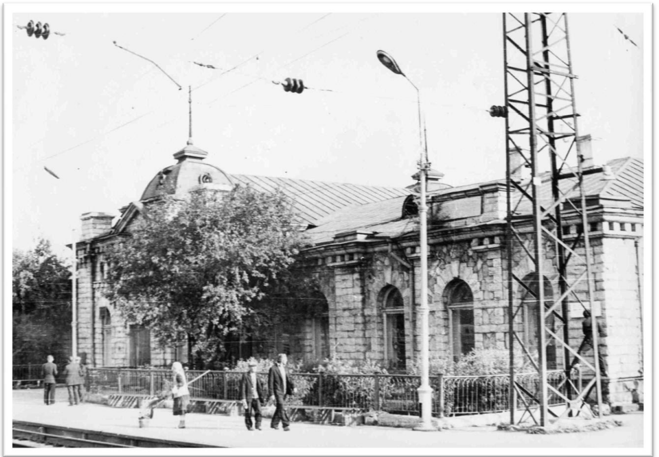
Станция Слюдянка. Здание ж/д вокзала. Дата съемки: 1984 г. Место съемки: Иркутская область.